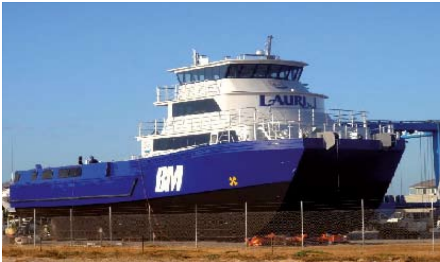
Arbeitsschiff aus Australien

tigem Design – Variationen sind möglich – liegt ganz wesentlich darin, dass man mit dem zu bauenden Schiff oder doch zumindest mit einem sehr ähnlichen, gewissermaßen schon vor dem Bau Probe fahren kann. Die Friesen nutzten die Chance und waren von den guten Seegangs- und Manöviereigenschaften des Fahrzeugs überzeugt.