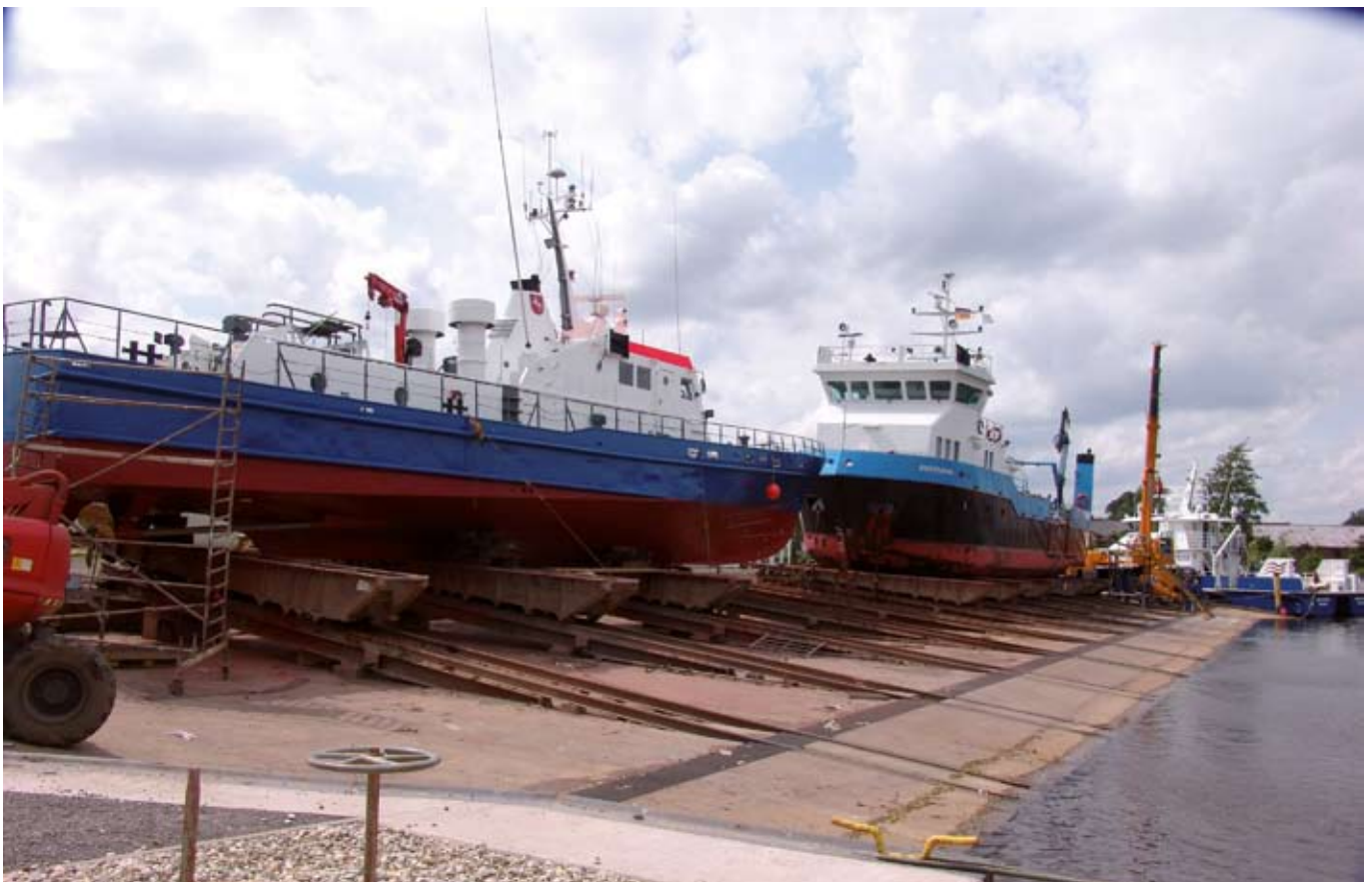
Neubauten auf der Helling der Diedrichswerft

Der erste Kontakt kam Anfang der 2008 mit der Firma Global Marine Design (GMD) in Westaustralien zu Stande. Die Australier sind nicht neu im Geschäft. Dort entstehen Yachten und Arbeitsschiffe die sie, etwas salopp ausgedrückt, auch als Baukastensatz verschicken. Darunter Schiffe bis etwa 36 m Länge. Der Vorteil des Verfahrens mit fer-