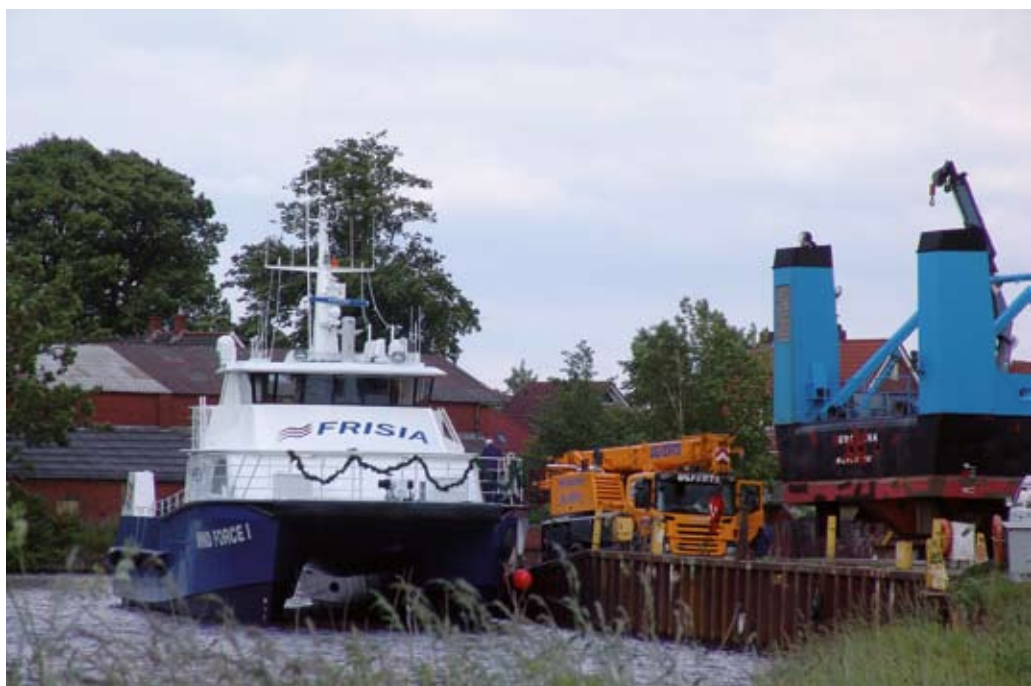
Der für die Taufe geschmückte Neubau

Heute hält die Frisia sicher, schnell, pünktlich und zuverlässig den Fährverkehr zu den Inseln aufrecht. Mit den jährlich zwischen 10 und 11.000 Schiffsabfahrten